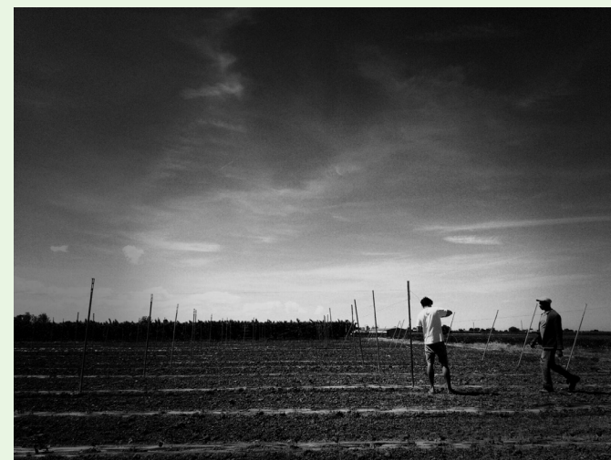
Títol de la fotografia: Profunditat, guanyadora del 1r. premi del X Concurs Fotogràfic Espígol 2017